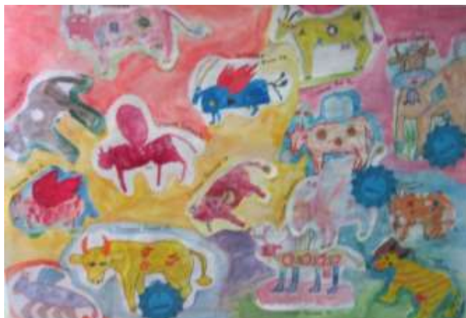
Коллаж—картина по итогам конкурса «Весёлая бурёнка» проводимый на общеэстетическом отделении.