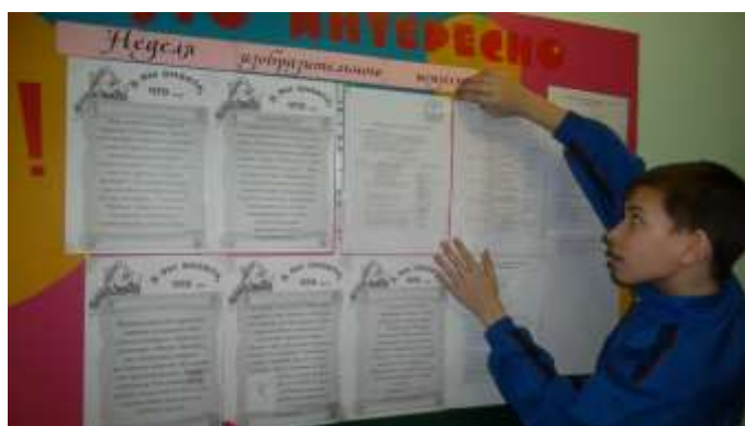
Оформление стенда «Это интересно» рубрика «А вы знаете, что...»