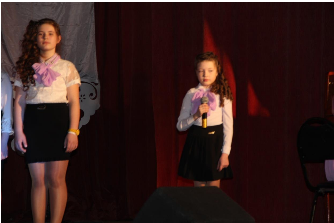
Солистка ХОРА Детской школы искусств.