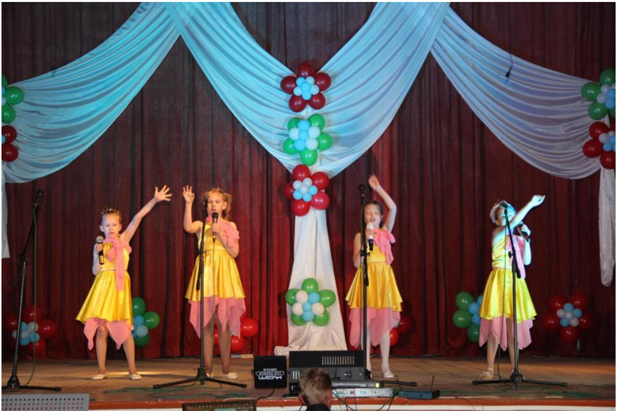
ФЕСТИВАЛЬ « СОЛНЕЧНЫЕ ЛУЧИКИ» ВОКАЛЬНАЯ ГРУППА « ДОМИСОЛЬКА».