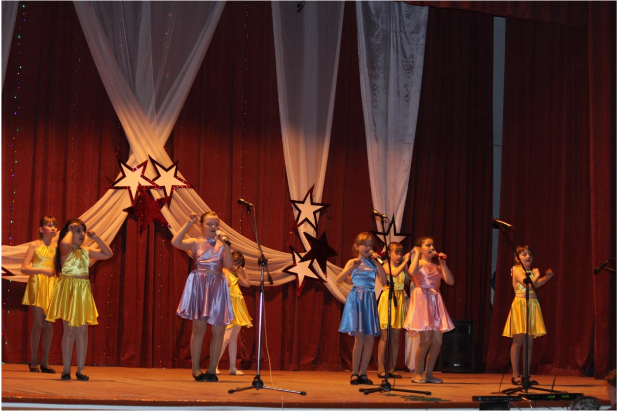
ОТЧЕТНЫЙ КОНЦЕРТ ДШИ 2014г.