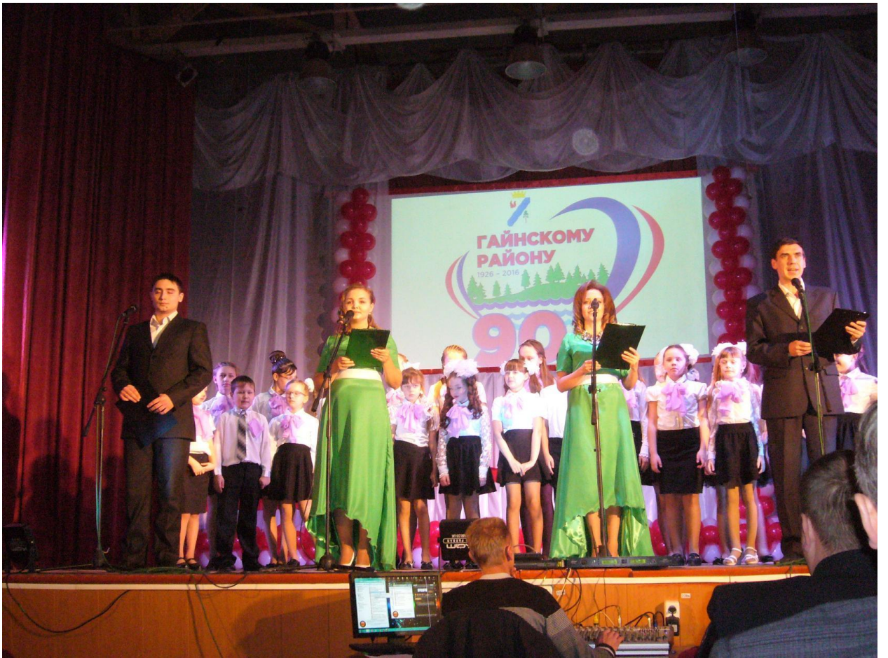
Хор Детской школы искусств «ВДОХНОВЕНИЕ»