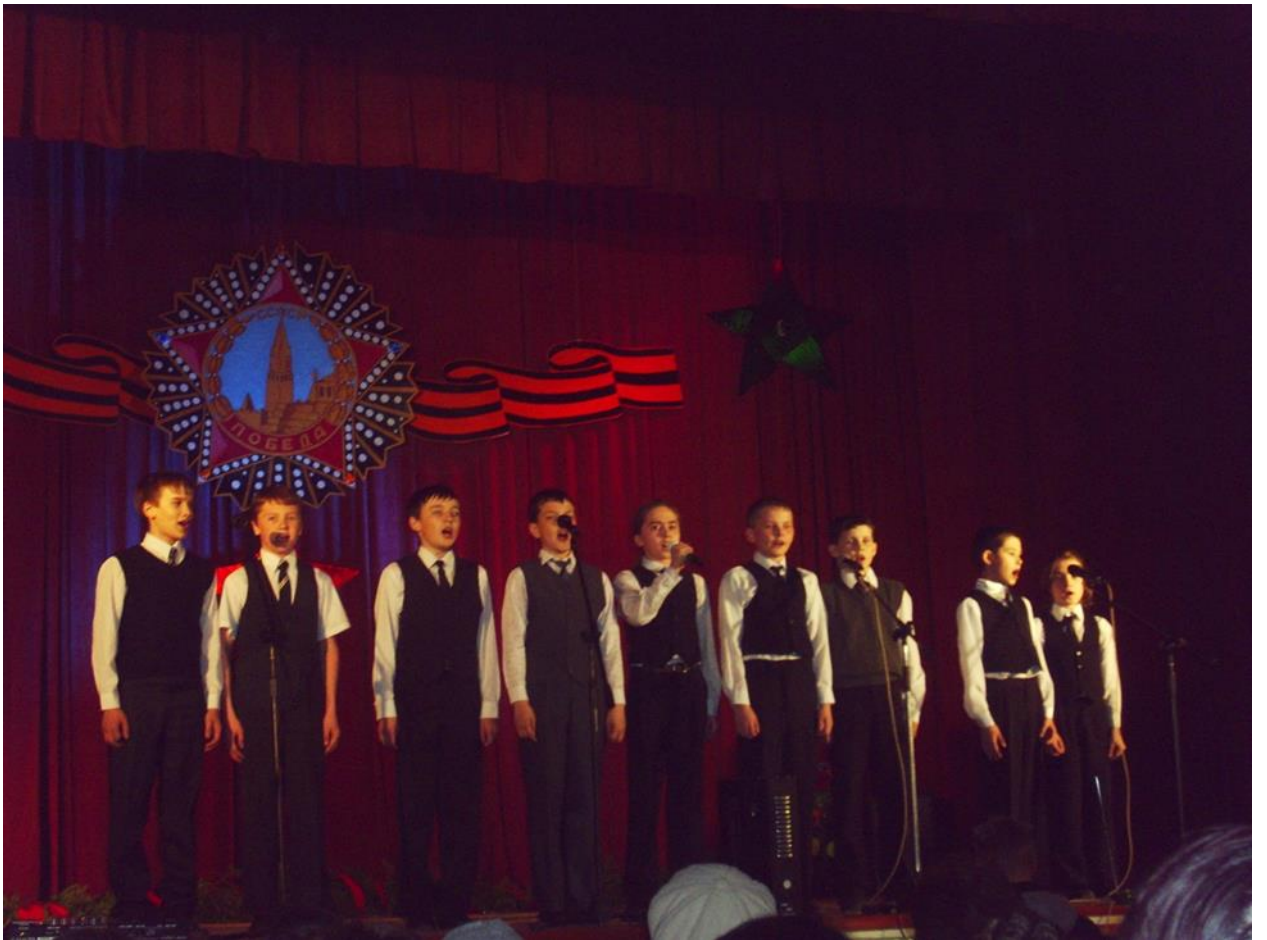
Концерт ко ДНЮ ПОБЕДЫ в КМЦ.