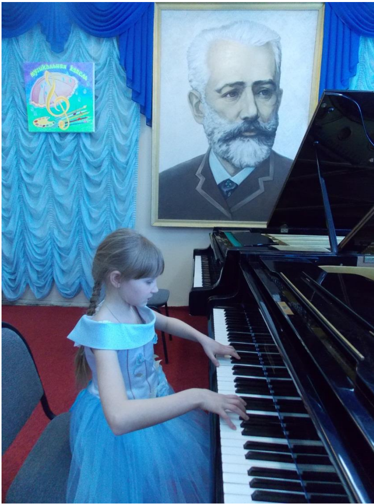
Фестиваль «МУЗЫКАЛЬНАЯ КАПЕЛЬ» г.Кудымкар.