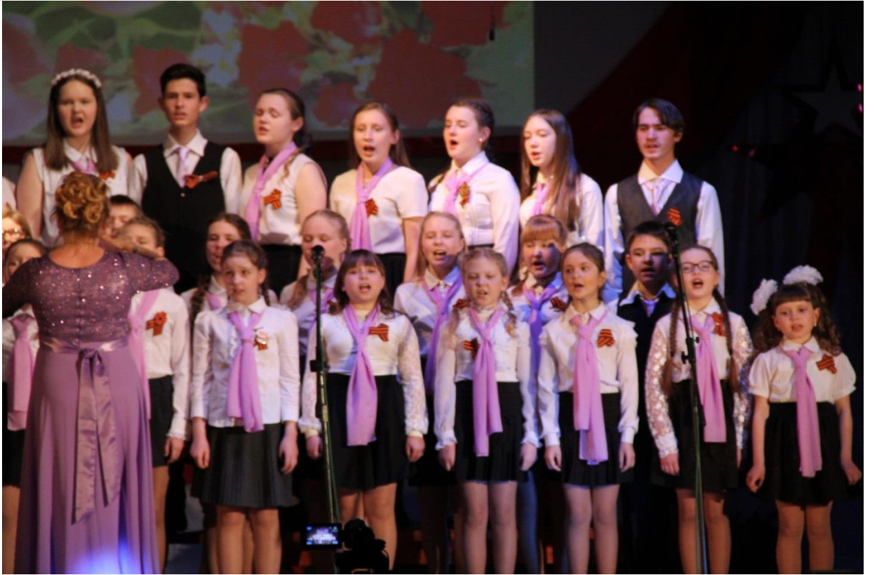
ХОР на различных концертах п.Гайны.