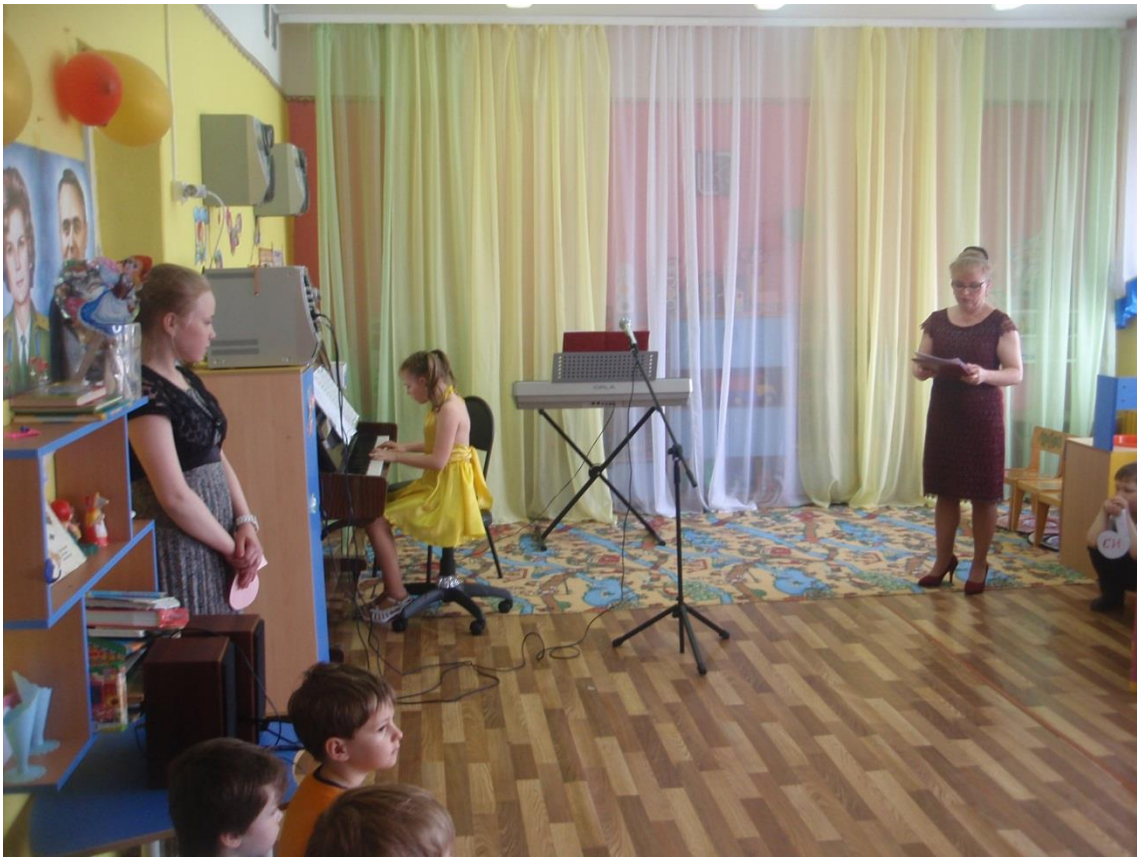
КОНЦЕРТ « Подарим нотки Песенке» в ДОУ « Солнышко» 2016г.