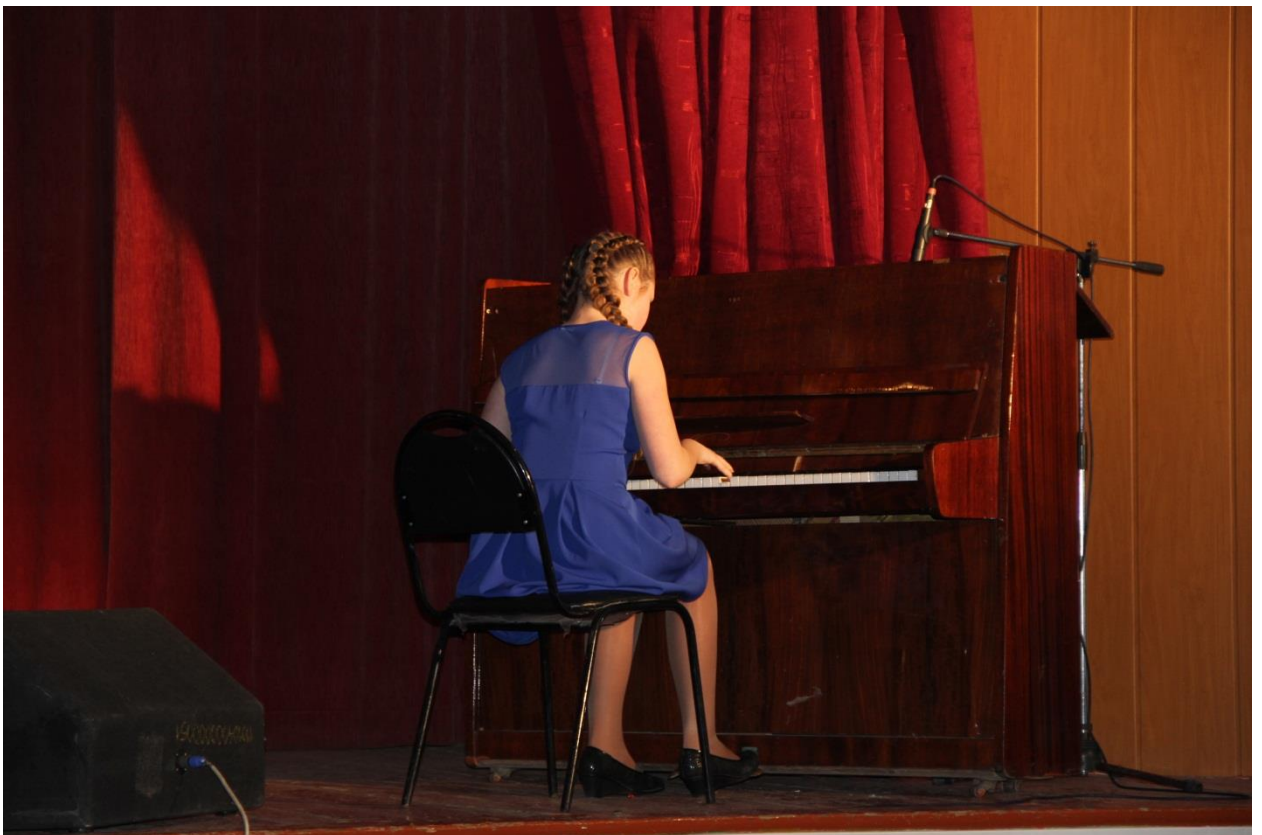
Учащаяся играет на концерте ко Дню матери в КМЦ.