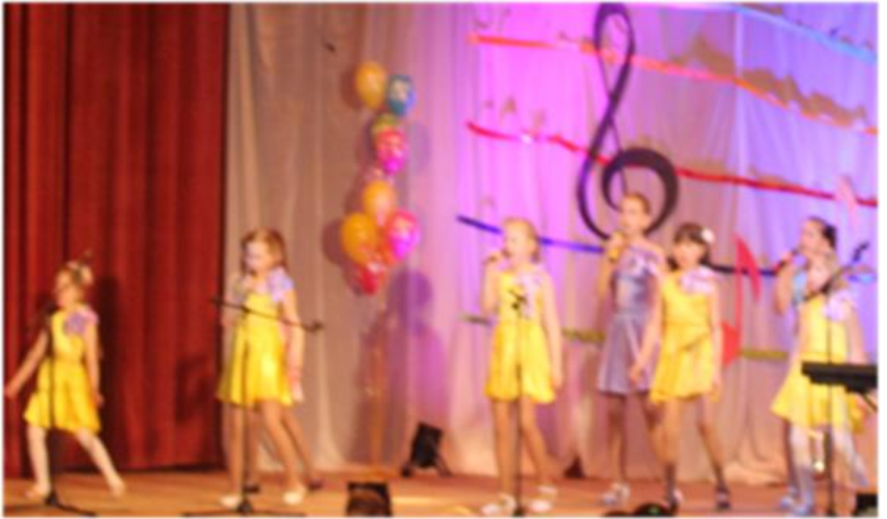
Вокальная группа « ДОМИСОЛЬКА»