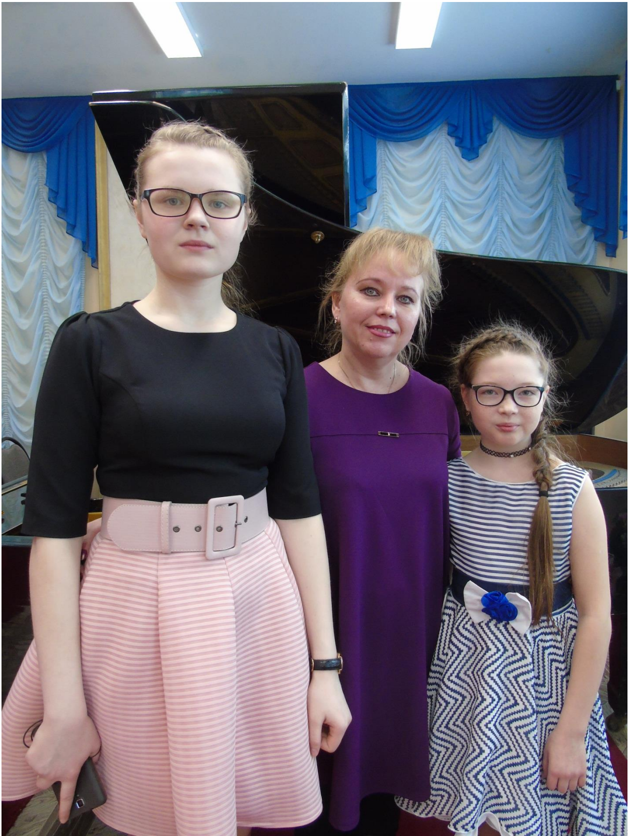
После фестиваля « МУЗЫКАЛЬНАЯ КАПЕЛЬ»