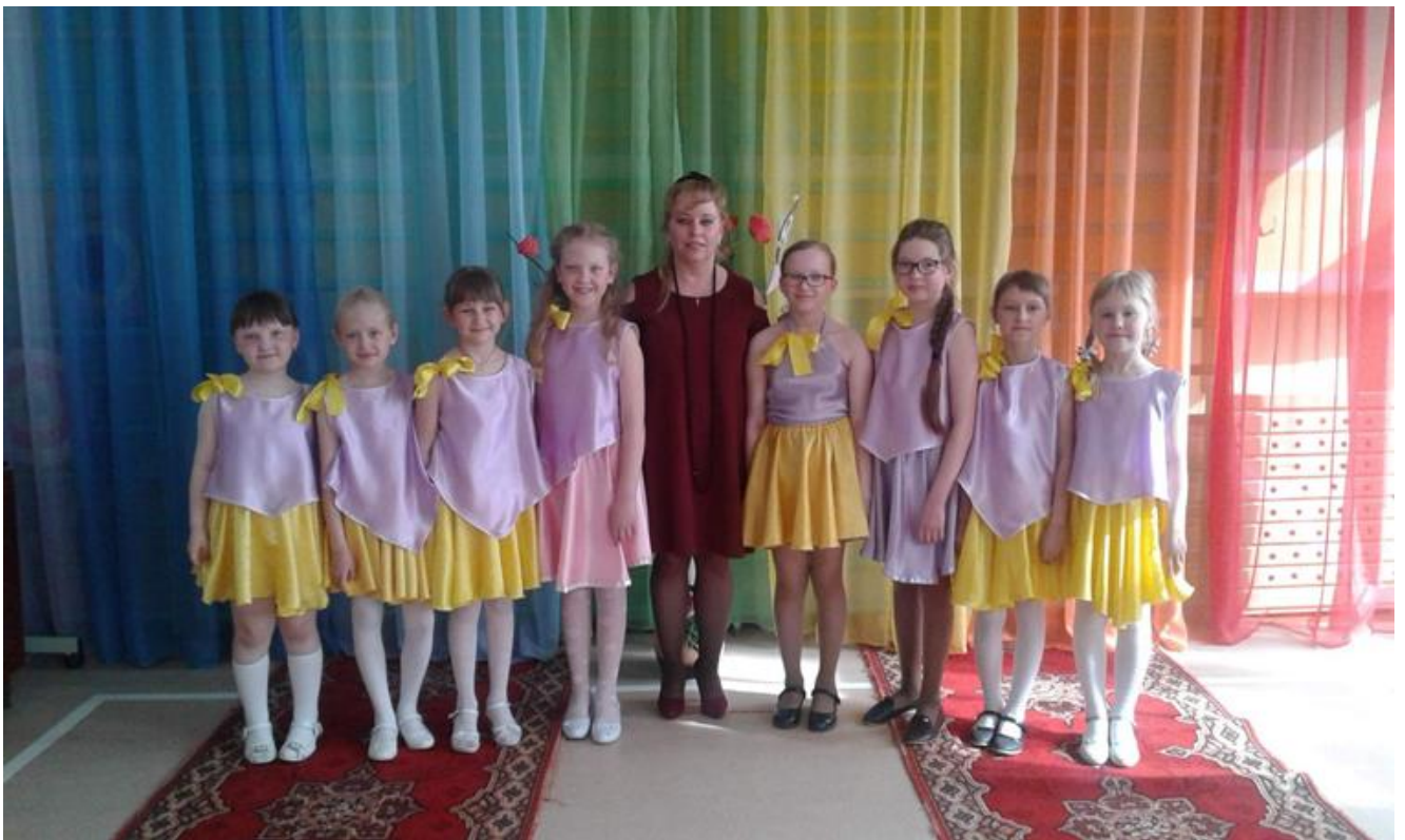
Вокальная группа « ДОМИСОЛЬКА»