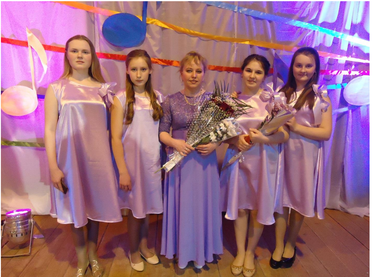
Вокальная группа « КАМЕРТОН».