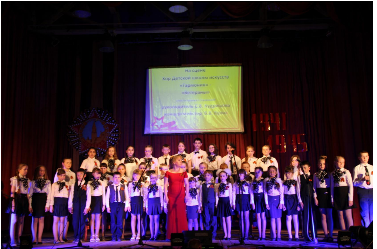
КОНЦЕРТ ко ДНЮ ПОБЕДЫ в КМЦ 2017г.