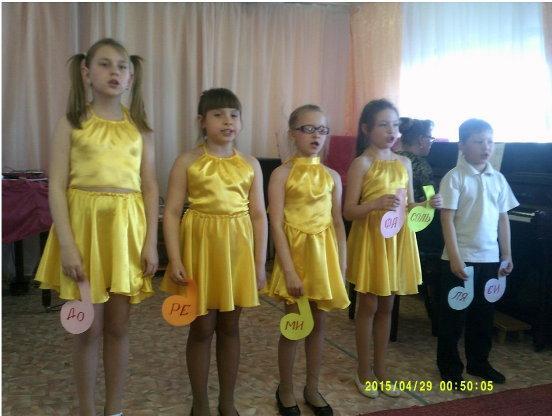
Концерт в ДШИ для первоклассников.