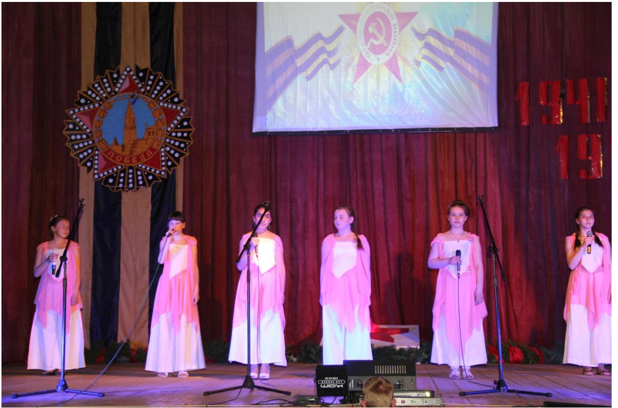
Вокальная группа « КАМЕРТОН»