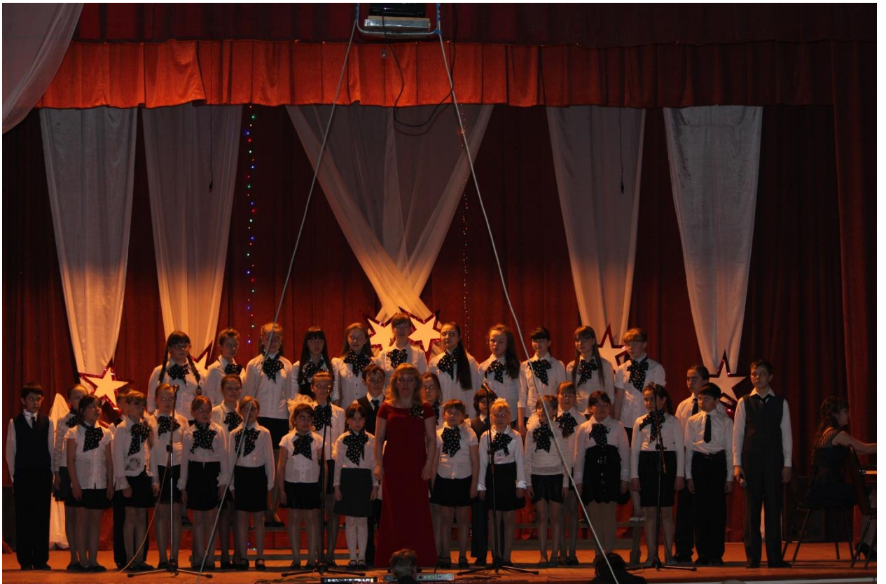
ОТЧЕТНЫЙ КОНЦЕРТ ДШИ 2014г.