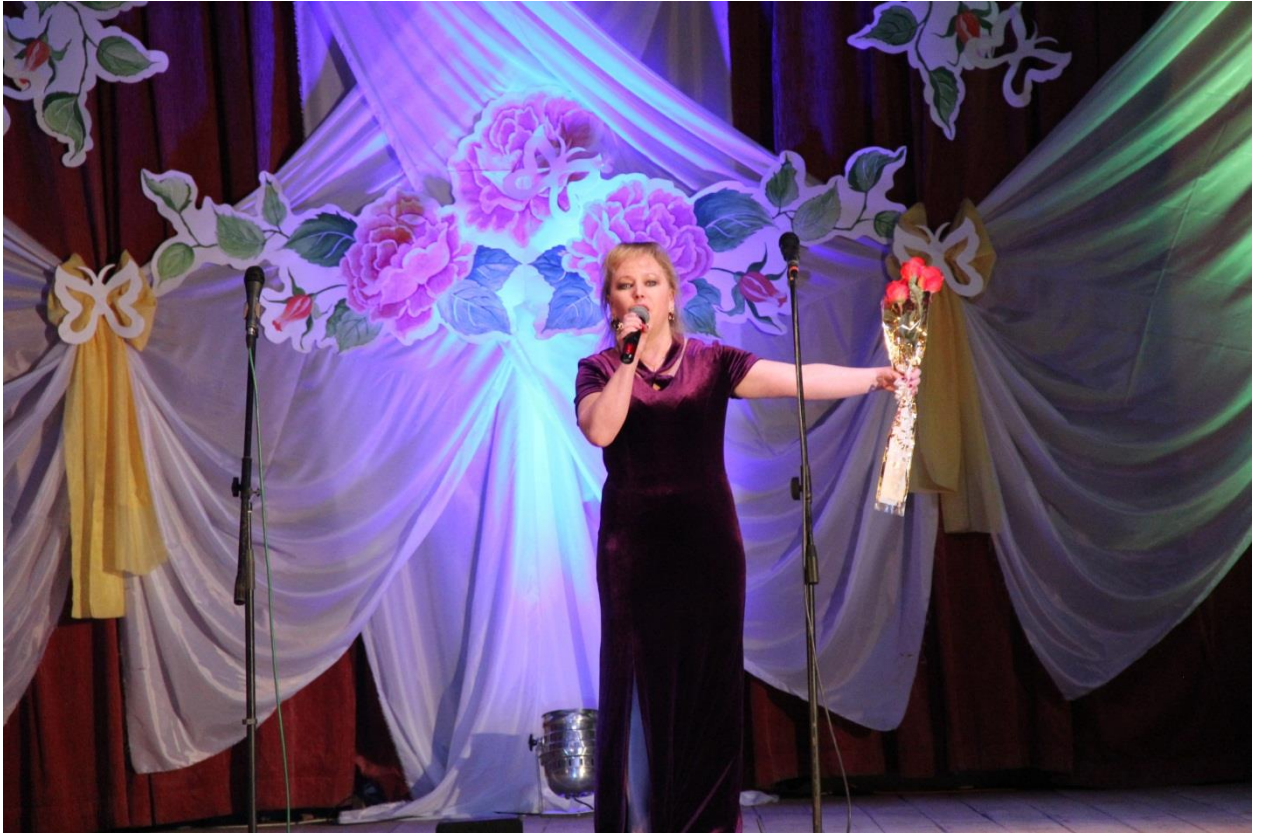
НА КОНЦЕРТЕ ко ДНЮ 8 МАРТА в КМЦ п.Гайны.