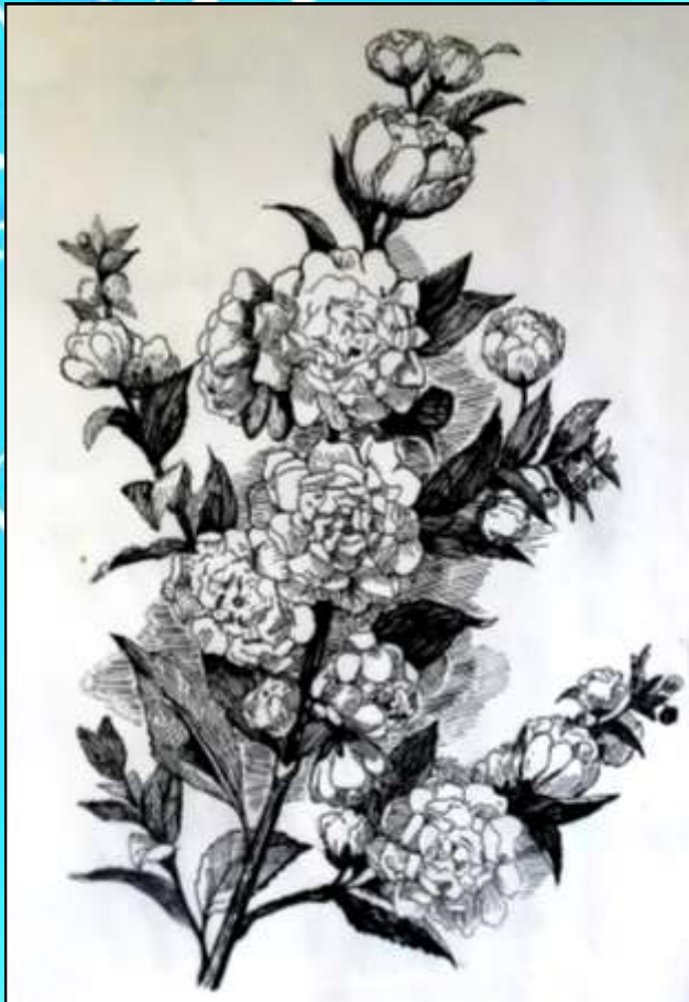
«Цветущая ветка» Михайловская Вероника Выпуск 2015 г.