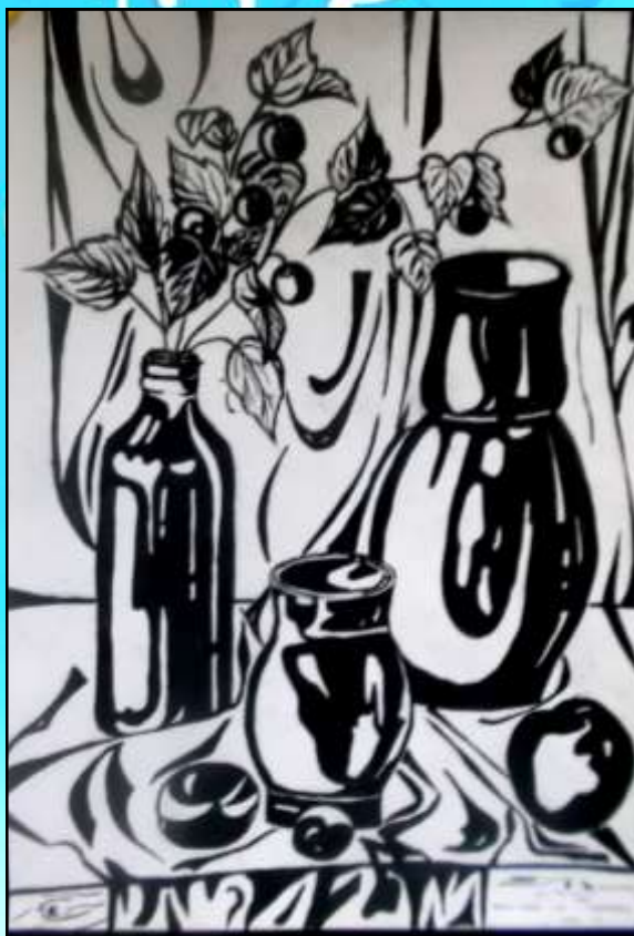
«Натюрморт с веткой»