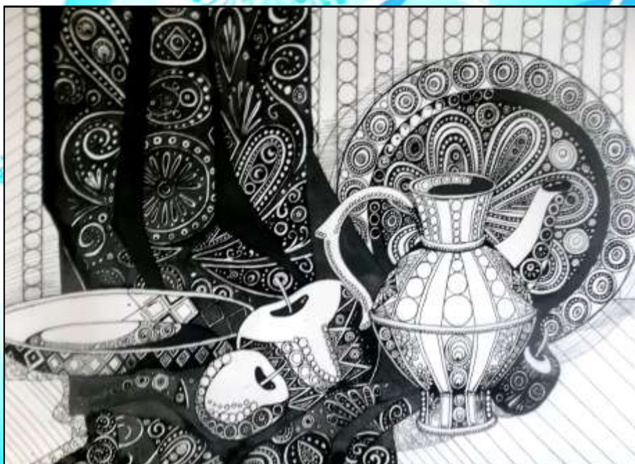
«Натюрморт с блюдом»