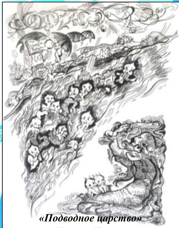
«Подводное царство» Харина Ксения Выпуск 2015 г.