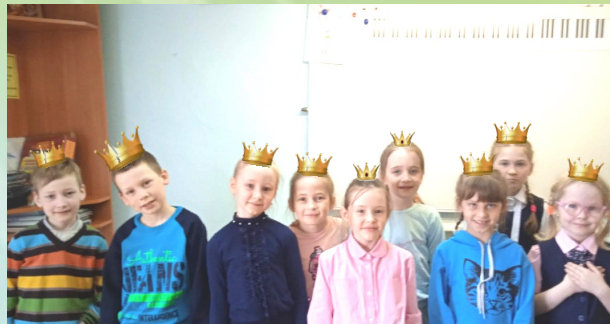
1 класс музыкального отделения